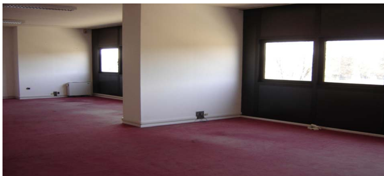
interno P 2°